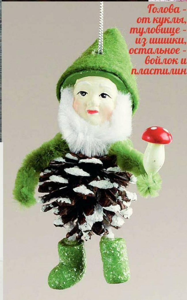
Толова – от куклы, туловище – из шишки, остальное – войлок и пластилин