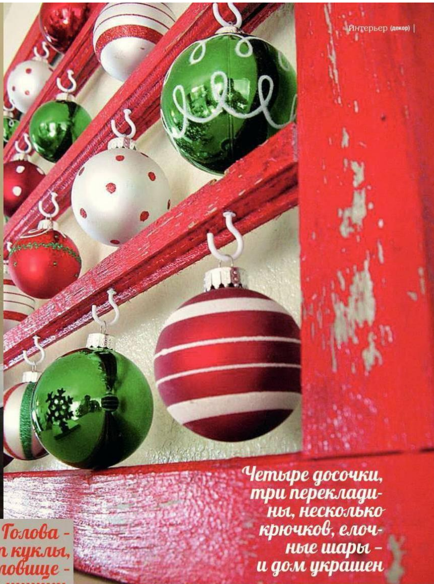
Четыре досочки, три перекладины, несколько крючков, елочные шары – и дом украшен