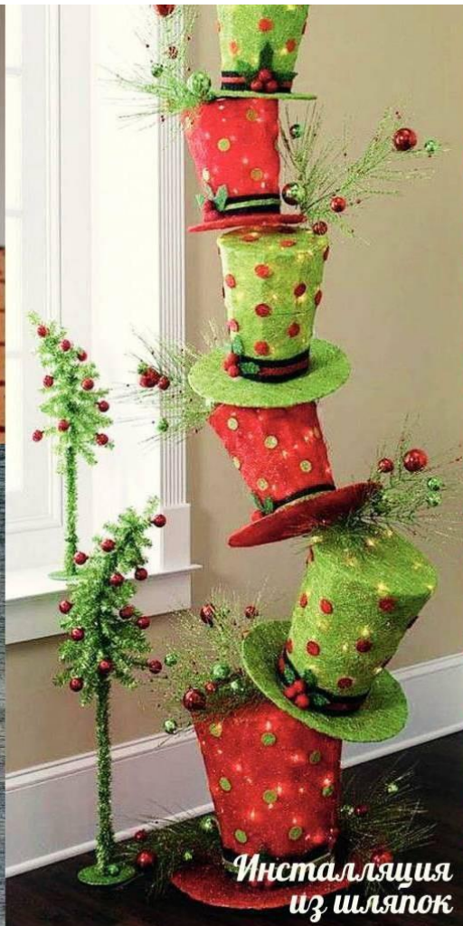
Инсталляция из шляпок