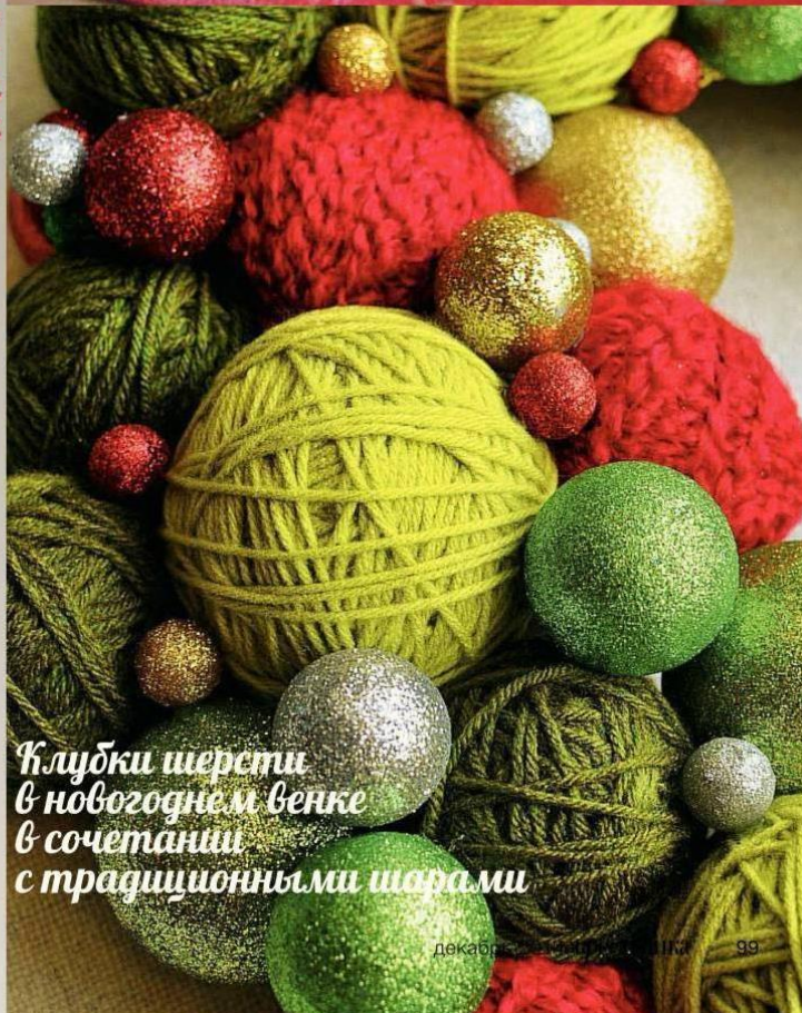
Клубки шерсти в новогоднем венке в сочетании с традиционными шарами