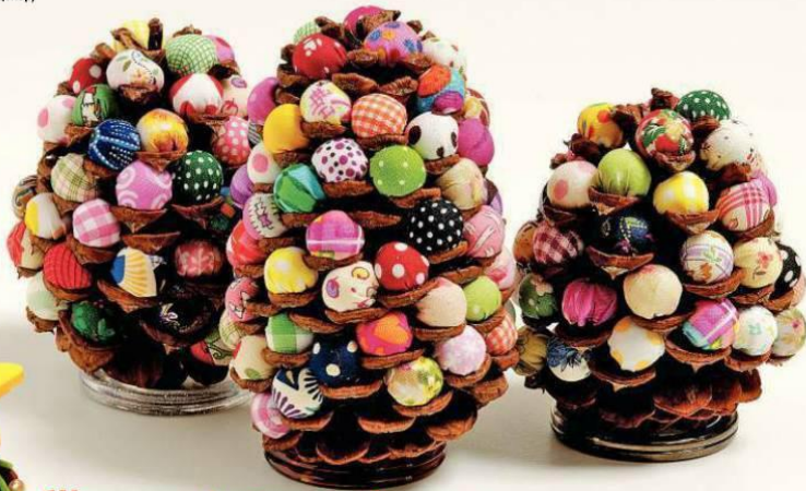
Шишки, фаршированные тряпичными «бусинками»